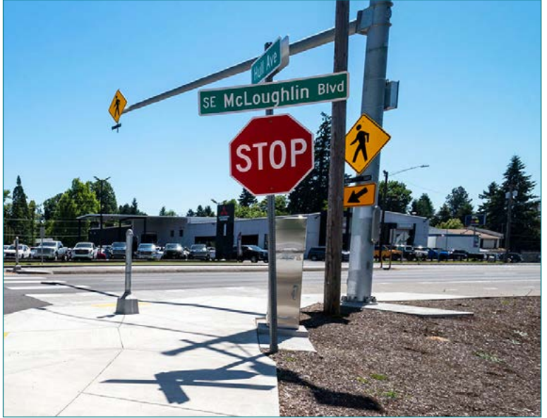
ARRIBA: Un ejemplo de cruce mejorado, también conocido como un faro de parpadeo rápido.